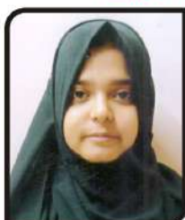
બદીયા શૈકતઅલી બહાત ગામ:- મોટાવરાછા ૭૧.૪૨ % (આર્ટ્સ)