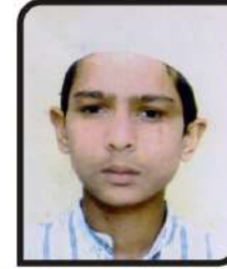
ઘઝાલીમ ઘઝાલ જસાલ ગામ:- મો. માંગરોલ ૭૧.૮૩ %