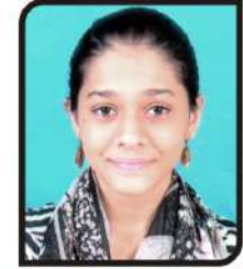
ઝમાના મો.સલીમ વડીયા ગામ:- રવિદરા ૭૫.૩૩ %