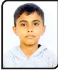
એઝામ મો.અમીન ઉમર ગામ:- મો. માંગરોલ ૮૨.૩૩ %