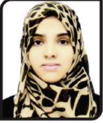
સના સલીમ લુહાત ગામ:- ભરૂચ (કાપોદરા) ૯૬.૨૦ %